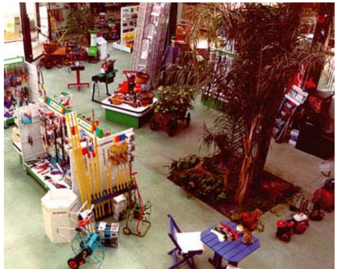
El Grupo Sabater está, entre otras cosas, especializado en instalaciones totalmente informatizadas para la regulación climática de invernaderos, automatización de la fertirrigación, ventilación, temperatura, CO 2 , etc...

Este año, el Grupo Sabater celebra su 100 aniversario y, con motivo del mismo, ha confeccionado su "Col.lecció del Centenari"; son diferentes publicaciones, destinadas a resaltar las etapas significativas de la empresa, y cuyos primeros números, "L'arada" y «El Planet de Mataró», han sido ya publicados con un atractivo y bien documentado